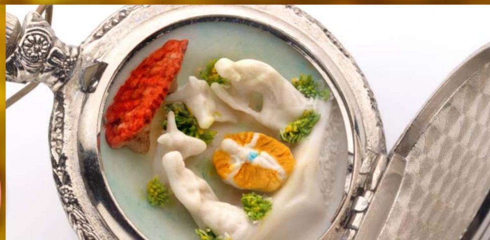
Presepe in ceramica di Capodimonte montato in una cassa d'orologio da tasca. Diametro cm.3,5