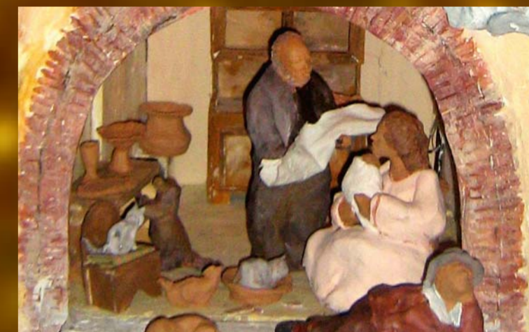
Maxipresepe in ambiente romano ottocentesco Particolare della Natività