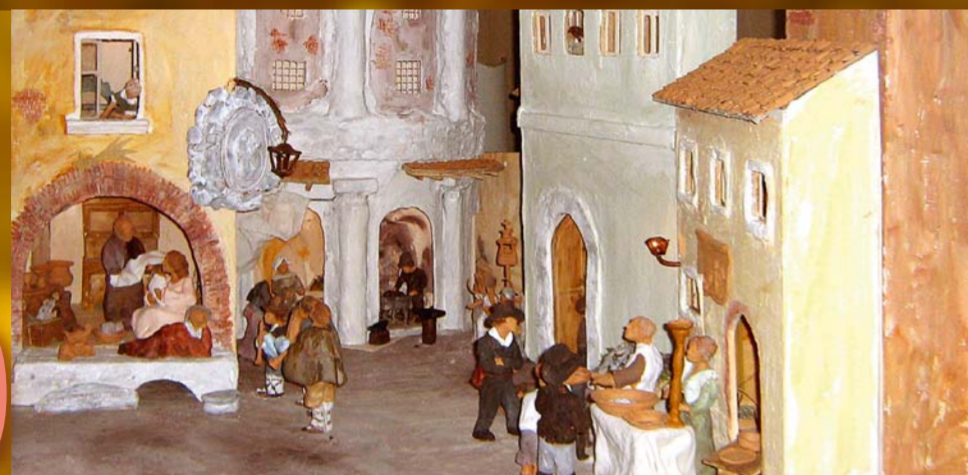
Maxipresepe con scorcio romano ottocentesco