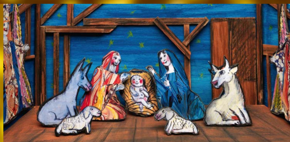
Emanuele Luzzati, Bozzetto-Presepe Legno e collage - Genova 1998