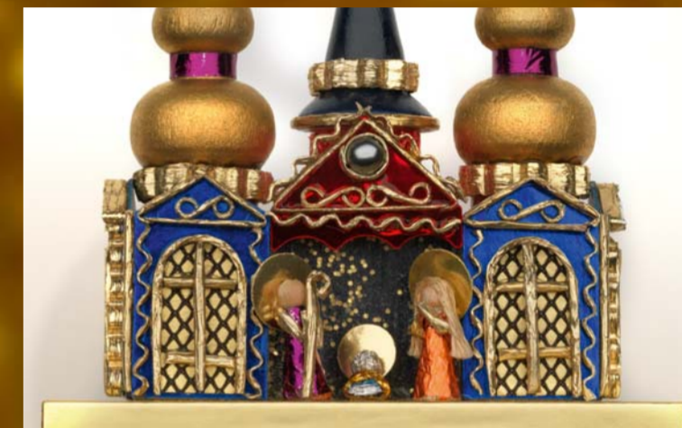
Minipresepe in palazzo di fantasia. Origine: Polonia. cm. 6,5x3x7,5