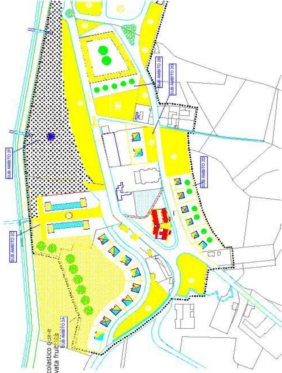
AMBITO D'INTERVENTO 2 : RONZONE

La struttura sarà utilizzata nel periodo non scolastico quale centro estivo per ragazzi, connesso alla ritrovata fruibilità della fascia fluviale